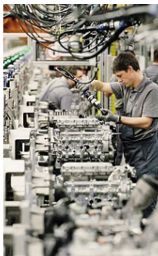
Migliorano le aspettative

cretere il bagaglio di competenze - dato in crescita rispetto al quadrimestre precedente - e, per favorire l'inserimento di nuovi talenti in azienda, il 42% delle imprese ha già attivato partnership con ITS e Università, mentre il 34% si muoverà in questo senso entro l'anno. Questo è lo scenario delineato dall'Osservatorio MECSPE sull'industria mani-