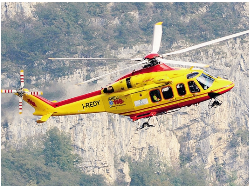
Il corpo recuperato dal soccorso alpino